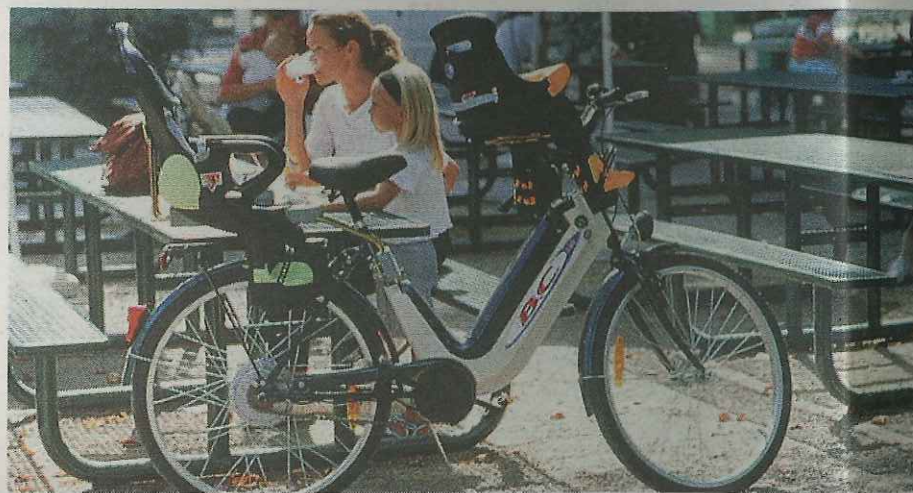
Comoda Con la bici elettrica meno fatica nel trasportare i bimbi. A destra, il pubblico del salone

La bici, anzi l'urban bike, è la regina dell'estate in città: forse per questo è nata l'idea di dedicare alle due ruote, in pieno luglio, un evento come la rassegna specializzata Eica 2011, Esposizione internazionale ciclo e accessori. La manifestazione, da sabato a domenica, a FieraMilanoCity, è figlia della conosciutissima Eicma (che in autunno apriva in concomitanza col Salone della Moto). Ora questa edizione «e» si propone come nuova, e al tempo stesso consolidata, attrazione per i tanti appassionati. Oltre alle anteprime assolute, con gli ultimi modelli e componenti, presentati da marchi affermati, Bianchi, Carrera, Colnago, De Rosa, Olmo, Shimano e altri, la formula di Eica metterà a disposizione dei visitatori una pista test ride per prove gratuite dei mezzi. Sarà anche possibile acquistare i prodotti dagli stessi espositori, assistere a spettacolari esibizioni di bike trial e ammirare i cimeli (maglie, bici da corsa...) dei grandissimi campioni